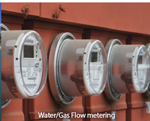
Water/Gas Flow metering