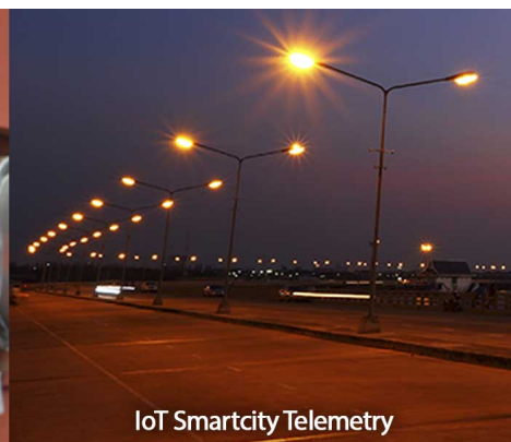
IoT Smartcity Telemetry